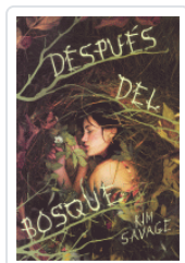
DESPUES DEL BOSQUE SAVAGE, KIM