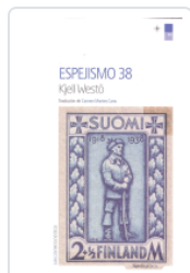
ESPEJISMO 38 WESTO, KJELL