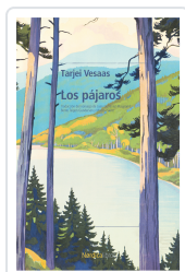
LOS PÁJAROS VESAAS, TARJEI