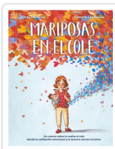
MARIPOSAS EN EL COLE PEÑALVER, CINDY