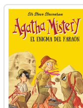
AGATHA MISTERY 1. EL ENIGMA DEL FARAON STEVENSON, SIR STEVE