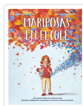
MARIPOSAS EN EL COLE PEÑALVER, CINDY