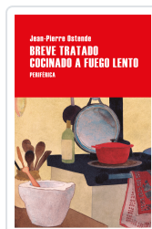
BREVE TRATADO COCINADO A FUEGO LENTO OSTENDE, JEAN-PIERRE