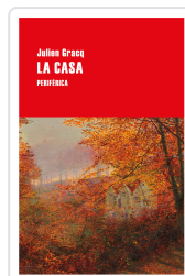
CASA GRACQ, JULIEN