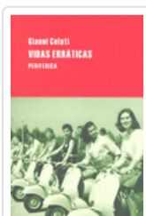
VIDAS ERRATICAS CELATI, GIANNI