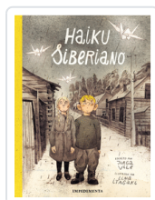
HAIKU SIBERIANO ITAGAKI / VILE