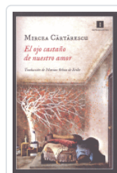
OJO CASTAÑO DE NUESTRO AMOR CARTARESCU, MIRCEA