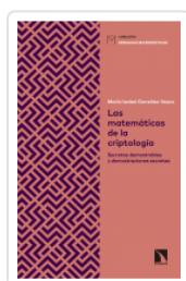
MATEMATICAS DE LA CRIPTOLOGIA GONZALEZ VASCO, MARIA ISABEL