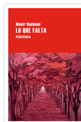
LO QUE FALTA HACHEMI, MUNIR