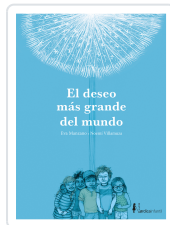
DESEO MAS GRANDE DEL MUNDO, EL MANZANO, EVA