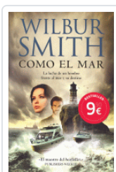
COMO EL MAR (N/E) SMITH, WILBUR