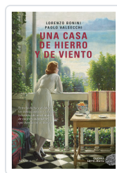
UNA CASA DE HIERRO Y DE VIENTO BONINI, LORENZO/ VALSECCHI, PAOLO