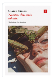
NUESTROS DÍAS SERÁN INFINITOS FULLER, CLAIRE