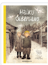
HAIKU SIBERIANO ITAGAKI / VILE