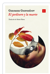
El jardinero y la muerte Gospodinov, Gueorgui