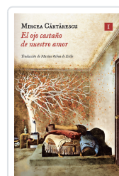
OJO CASTAÑO DE NUESTRO AMOR CĂRTĂRESCU, MIRCEA