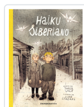
HAIKU SIBERIANO ITAGAKI / VILE