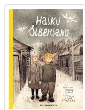
HAIKU SIBERIANO ITAGAKI / VILE