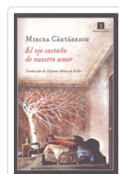
OJO CASTAÑO DE NUESTRO AMOR CARTARESCU, MIRCEA