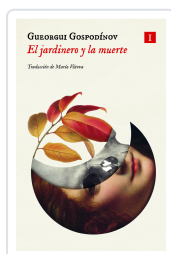
El jardinero y la muerte Gospodinov, Gueorgui