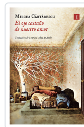
OJO CASTAÑO DE NUESTRO AMOR CĂRTĂRESCU, MIRCEA