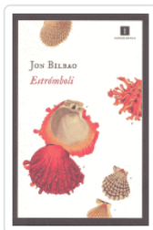
ESTROMBOLI BILBAO, JON