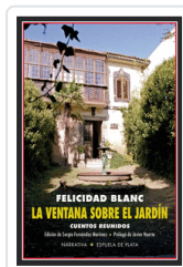
VENTANA SOBRE EL JARDIN BLANC, FELICIDAD