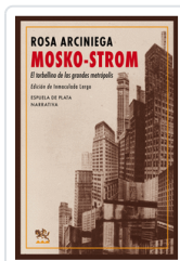
MOSKO-STROM ARCINIEGA, ROSA