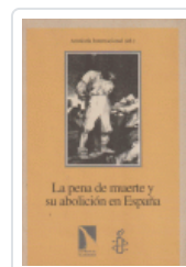
PENA DE MUERTE Y SU ABOLICION EN ESPAÑA, LA AA.VV