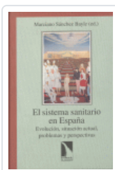
SISTEMA SANITARIO EN ESPAÑA SANCHEZ BAYLE, MARCIANO