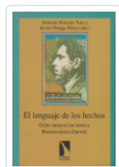
LENGUAJE DE LOS HECHOS, EL MORALES, A.