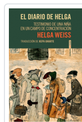
EL DIARIO DE HELGA WEISS, HELGA