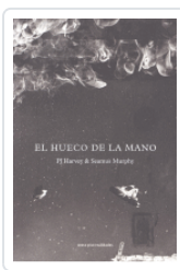
HUECO DE LA MANO HARVEY ; MURPHY