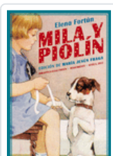
MILA Y PIOLIN FORTUN, ELENA