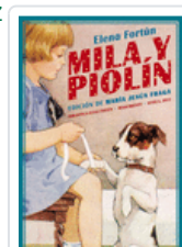
MILA Y PIOLIN FORTUN, ELENA