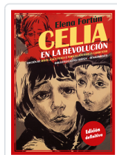
CELIA EN LA REVOLUCION FORTUN, ELENA