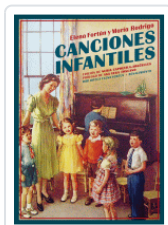
CANCIONES INFANTILES FORTUN / RODRIGO