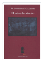
ESTRECHO RINCON SOMERSET MAUGHAM, WILLIAM