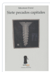
SIETE PECADOS CAPITALES PAVIC, MILORAD