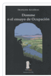
DOMME O EL ENSAYO DE OCUPACION AUGIERAS, FRANCOIS