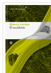
El accidente Lacasa, Blanca