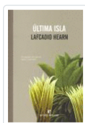
ÚLTIMA ISLA HEARN, LAFCADIO