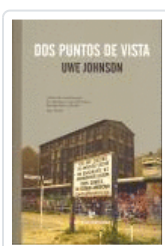
DOS PUNTOS DE VISTA JOHNSON, UWE