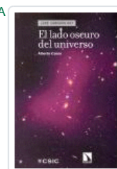
LADO OSCURO DEL UNIVERSO CASAS, ALBERTO