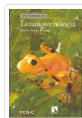
NANOTECNOLOGIA SERENA DOMINGO, PEDRO A.