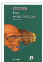
NEANDERTALES ROSAS ANTONIO