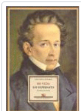
MI VIDA SIN ESPERANZA LEOPARDI, GIACOMO