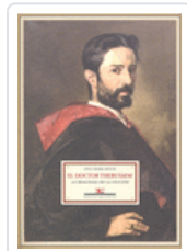
DOCTOR THEBUSSEM: REALIDAD DE LA FICCION YBARRA MENCOS, IÑIGO