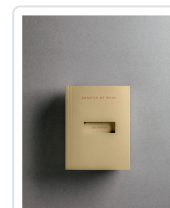
ARCHIVO, UN DE WAAL, EDMUND