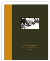
IT JUST HAPPENED (ING) COLACELLO, BOB