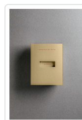
ARCHIVO, UN DE WAAL, EDMUND