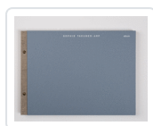
ALBUM TAEUBER-ARP, SOPHIE