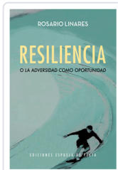
RESILIENCIA O LA ADVERSIDAD COMO OPORTUNIDAD LINARES, ROSARIO