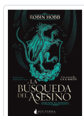
La búsqueda del asesino Hobb, Robin