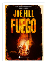
FUEGO HILL, JOE