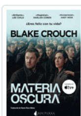
MATERIA OSCURA CROUCH, BLAKE