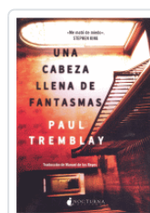
UNA CABEZA LLENA DE FANTASMAS TREMBLAY, PAUL