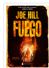
FUEGO HILL, JOE