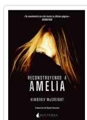
RECONSTRUYENDO A AMELIA MCCREIGHT, KIMBERLY