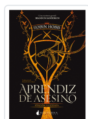
Aprendiz de asesino Hobb, Robin