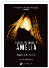
RECONSTRUYENDO A AMELIA MCCREIGHT, KIMBERLY