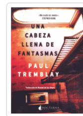
UNA CABEZA LLENA DE FANTASMAS TREMBLAY, PAUL