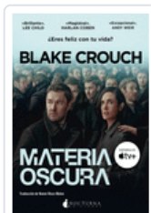
MATERIA OSCURA CROUCH, BLAKE