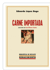
CARNE IMPORTADA LOPEZ BAGO, EDUARDO