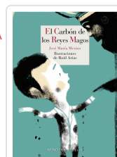
EL CARBÓN DE LOS REYES MAGOS MERINO / ARIAS