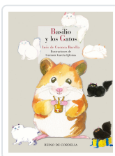
BASILIO Y LOS GATOS DE CUENCA BARELLA / GARCIA IGLESIAS