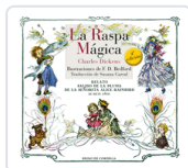
RASPA MAGICA DICKENS ; BEDFORD