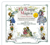
RASPA MAGICA DICKENS ; BEDFORD