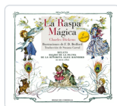
RASPA MAGICA DICKENS ; BEDFORD