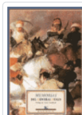
MEMORIAS GENERAL HUGO