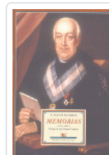
MEMORIAS (1807-1808) ESCOQUIZ, JUAN DE