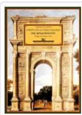
ESPAÑA EN LA VIDA ITALIANA DEL RENACIMIENTO CROCE/PRIETO/GONZALEZ