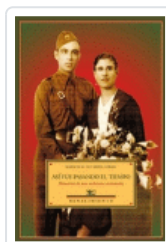
ASI FUE PASANDO EL TIEMPO HISTORIA DE UNA MILICIANA EXTREMEÑA MEJIAS/PULIDO