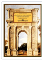
ESPAÑA EN LA VIDA ITALIANA DEL RENACIMIENTO CROCE/PRIETO/GONZALEZ