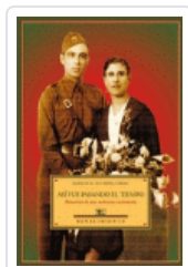
ASI FUE PASANDO EL TIEMPO HISTORIA DE UNA MILICIANA EXTREMEN MEJIAS/PULIDO