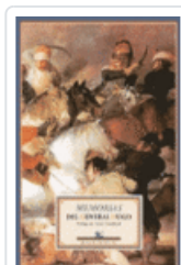
MEMORIAS GENERAL HUGO