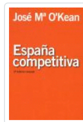
ESPAÑA COMPETITIVA 2/E O'KEAN, JOSE MARIA