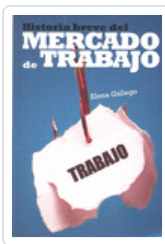
HISTORIA BREVE DEL MERCADO DE TRABAJO GALLEGO, ELENA