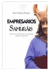
EMPRESARIOS Y SAMURAIS HIDALGO NAVARRO, RAFAEL