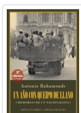
UN AÑO CON QUEIPO DE LLANO 3/E BAHAMONDE, ANTONIO