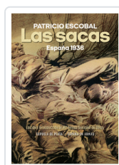
SACAS ESPAÑA 1936 ESCOBAL, PATRICIO