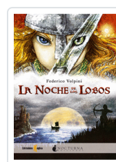
NOCHE DE LOS LOBOS VOLPINI, FEDERICO