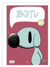
BATU 2 TUTE