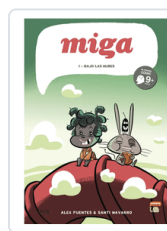
MIGA 1 BAJO LAS NUBES FUENTES ; NAVARRO