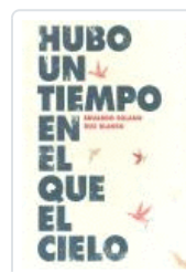
HUBO UN TIEMPO EN EL QUE EL CIELO SOLANO ; BLANCO