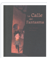
CALLE DEL FANTASMA GONZALEZ ; BLANCO