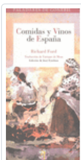
COMIDAS Y VINOS DE ESPAÑA FORD, RICHARD