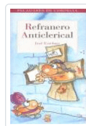
REFRANERO ANTICLERICAL ESTEBAN, JOSE