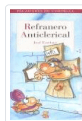
REFRANERO ANTICLERICAL ESTEBAN, JOSE