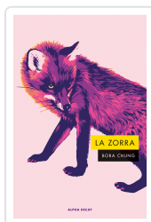
Zorra, La Chung, Bora