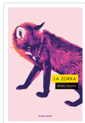
Zorra, La Chung, Bora