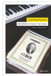
CONTRAPUNTO KENNICOTT, PHILIP