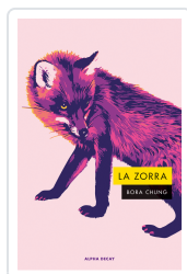
Zorra, La Chung, Bora