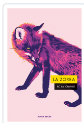
Zorra, La Chung, Bora