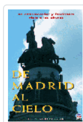
DE MADRID AL CIELO AGROMAYOR