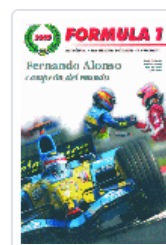
FORMULA 1 (2005) FERNANDO ALONSO:CAMPEON DEL MUNDO D'ALESSIO ; STIRANO ; VAN ELDIK ; MARSH